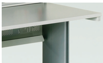
Goulotte de câble